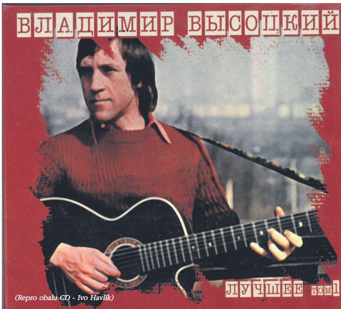
(Repro obalu CD - Ivo Havlík)

„Myslel sis, přítel můj a teď? Ryba rak nebo tak či tak? Odpověď bys rád chtěl znát Můžeš-li na něj dát S sebou do hor ho vem a jdem Vzhůru po boku bok co krok Lanem svým s ním se svaž, ať znáš S kým čest máš, s kým čest máš Jestli zlomí jej vzdor těch hor Skrčí nos, ohne hřbet, chce zpět Z ledovců na skalách když má strach A přemýšlí, jak by plách Pak ho znáš, pak ho znáš až až Jen ho nech, ať si jde, kam chce Nežli s ním, radši sám jdu sám Takovým nezpívám“