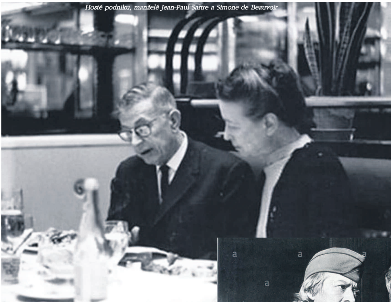
Hosté podniku, manželé Jean-Paul Sartre a Simone de Beauvoir

velké, že prý zde každý večer zmizí třicet talířů i talířků s jejím emblémem... Nejspíš osud všech slavných kaváren.